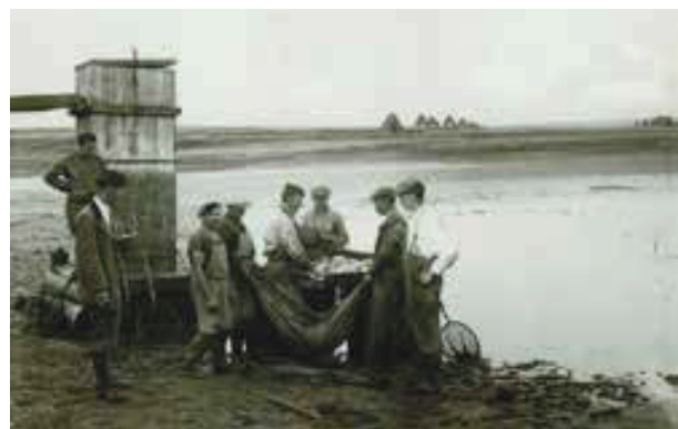
Abfischen am Streitteich nahe Heidenreichstein im Jahr 1932 - damals wie auch heute wird viel von Hand erledigt.