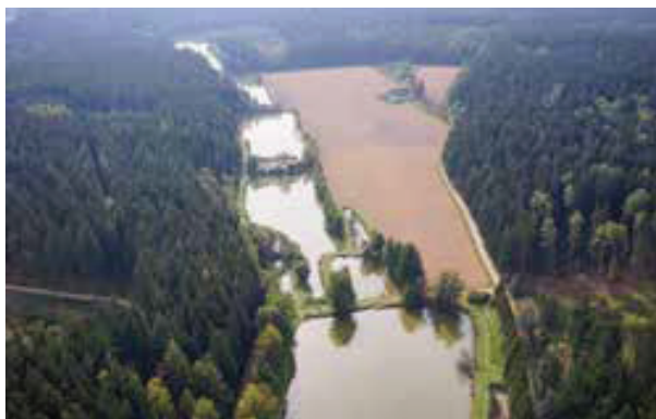
Kleinteiche bilden charakteristische Landschaftselemente in vielen Gemeinden im nördlichen Waldviertel, allen voran im Gmünder Bezirk. Die Teiche sind vom Menschen geschaffen und bilden seit über 700 Jahren einen wertvollen Bestandteil der Kulturlandschaft. Kettenteichanlage in Reitzenschlag.