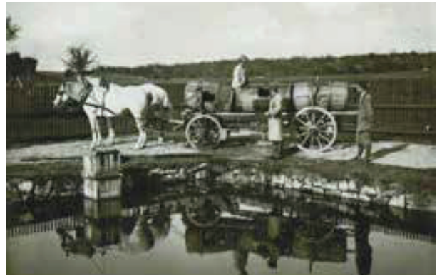
Vom Teich zur Hälteranlage wurden die geernteten Karpfen im Jahr 1932 mit Kutsche und Fässern transportiert. Die Abladung erfolgte mit Rutsche (links) oder mit Kescher (rechts).