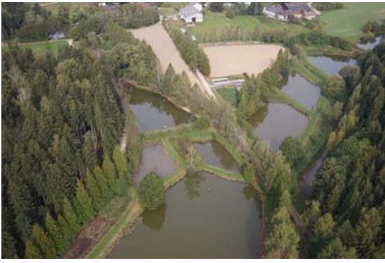
Waldviertler Teichlandschaft